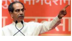
घोषणा त्यांनी केली आहे.

अयोध्येत दानपेटी व देणगी निधीच्या अपहार प्रकरणावरून रणशिंग मुंबई (प्रतिनिधी) - अयोध्येतील श्रीराम मंदिरातील दानपेटी आणि देणगी निधीच्या कथित अपहाराच्या प्रकरणावर शिवसेना ठाकरे गटाचे प्रमुख उद्धव ठाकरे यांनी भारतीय जनता पक्षावर अत्यंत आक्रमक शब्दांत जोरदार हल्लाबोल केला. राम मंदिराच्या निधीवर भाजपने दरोडा टाकल्याचा थेट आरोप करत उद्धव ठाकरे यांनी भाजपविरोधात थेट रणशिंग फुंकले आहे. या लुटीचा जाब विचारण्यासाठी येत्या रविवारी (दि. ५ जुलै) दादर येथील हनुमान मंदिराजवळ भव्य 'रामरक्षा' आंदोलन करण्याची घोषणा त्यांनी केली आहे. पत्रकार परिषदेत बोलताना उद्धव ठाकरे म्हणाले की, आज देशामध्ये भारतीय जनता पक्षाच्या काळात राम मंदिराचा मुद्दा वेगळ्या एका गोष्टीमुळे चर्चेला जातोय, हे दुदैव आहे. राजकीय पक्ष तोडले जात आहेत, आमदार गोव्यात किंवा इतरत्र पळवले जात आहेत, खरेदी-विक्री होते आहे आणि याला 'अपॉरिशन' नाव दिले जाते. मा आता ऑपरेशन राम मंदिर भाजप करतय का? हा एक महत्वाचा मुद्दा आहे. म्हणून मला असं वाटतं की, या सगळ्या बातम्या दाखवल्या जात असतील, नसतील, बातम्या छापून येत असतील नसतील, पण राम मंदिरावरील दरोडा तर टाकला जातोय, टाकला गेलाय; त्याचे पुरावे मुद्दा दिले गेले आहेत, काही जणांचे म्हणणे आहे की चोरीचा पैसा इतर पक्ष फोडण्यासाठी वापरला जातोय, हे फार गंभीर आहे, असा आरोप त्यांनी केला.