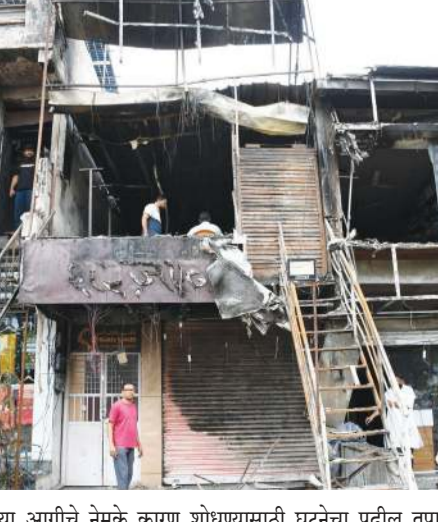
या आगीचे नेमके कारण शोधण्यासाठी घटनेचा पुढील तपास करत आहेत.

नांदेड (प्रतिनिधी) - शहरातील केळी संशोधन केंद्रासमोर असलेल्या 'शहजादी डिझायनर' या प्रसिद्ध कपड्यांच्या शोरूममध्ये मंगळवारी पहाटे भीषण आग लागली. या दुर्घटनेत लाखो रुपयांचे कपडे व इतर साहित्य जळून खाक झाले असून, यामध्ये लग्न सोहळ्यासाठी आणलेल्या महागड्या कपड्यांचाही समावेश होता. मिळालेल्या माहितीनुसार, ही घटना ७ जुलै रोजी पहाटे सुमारे ४ वाजता घडली. अचानक लागलेल्या आगीने काही वेळातच संपूर्ण इमारतीला कवेत घेतले. आगीची तीव्रता इतकी भीषण होती की, शोरूममधील बहुतांश साहित्य जळून राख झाले. आगीची माहिती मिळताच अभिषमन दलाचे जवान तात्काळ घटनास्थळी दाखल झाले. अभिषमन दलाच्या कर्मचाऱ्यांनी शर्थीचे प्रयत्न करून आगीवर नियंत्रण मिळवले. मात्र, आग आटोक्यात येईपर्यंत शोरूममधील बहुतांश माल साहित्याचे मोठे नुकसान झाले होते. प्राथमिक माहितीनुसार, सुदैवाने या घटनेत कोणतीही जीवितहानी झालेली नाही. मात्र, शोरूमचे मोठ्या प्रमाणावर आर्थिक नुकसान झाले आहे. स्थानिक प्रशासन आणि पोलीस