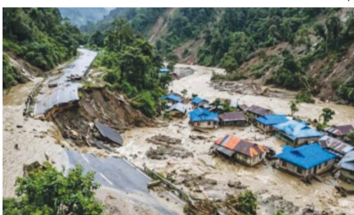
गेल्याने मोठी समस्या निर्माण झाली आहे. वाहिन्यांचे प्रचंड नुकसान झाले आहे. अनेक पाणीपुरवठा यंत्रणा, वीज खांबे आणि विद्युत ग्रामस्थांना आपली घरे सोडून शेतातील

इटानगर (प्रतिनिधी) - अरुणाचल प्रदेशातील लोअर सियांग जिल्ह्यात मुसळधार पावसामुळे निर्माण झालेल्या ढगफुटी आणि भूस्खलनामुळे जनजीवन विस्कळीत झाले आहे. या नैसर्गिक आपत्तीत आतापर्यंत ३ जणांचा मृत्यू झाला असून, तब्बल १४ गावांतील ३,१०० हून अधिक नागरिक प्रभावित झाले आहेत. अचानक आलेल्या पुराचा फटका शेती आणि पशुधनालाही मोठ्या प्रमाणावर बसला असून, अनेक वाहने वाहून गेली आहेत. पूर आणि भूस्खलनामुळे तबिरिपो साकू, लोगलू, रोहे आणि कौयू यांसारख्या गावांचा बाह्य जगाशी संपर्क पूर्णपणे तुटला आहे. सुमारे ५०० कुटुंबे अडकून पडली असून, गावाला जोडणारा झुलता पूल वाहून