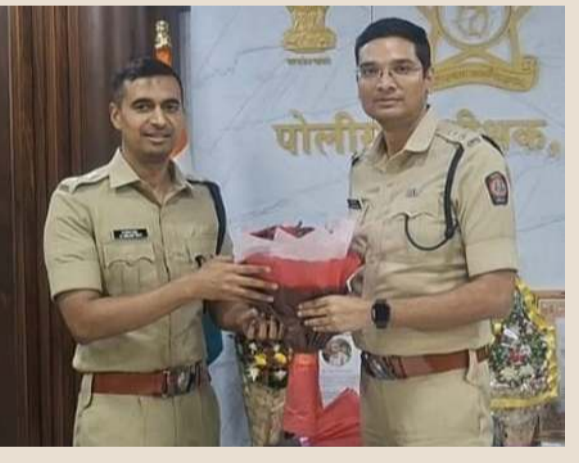
ध्येही त्यांचे महत्त्वपूर्ण योगदान राहिले आहे. छत्रपती संभाजीनगर येथील महाराष्ट्र दहशतवादविरोधी पथकात (एटीएस) पोलीस अधीक्षक म्हणून कार्यरत असताना त्यांनी गुप्त माहिती संकलन, सुरक्षा व्यवस्थापन आणि दहशतवादविरोधी मोहिमांमध्ये प्रभावी नेतृत्व केले.

पदावर जबाबदाऱ्या सांभाळण्या आहेत. प्रशिक्षण काळात त्यांनी इचलकरंजी येथे परिविक्षाधीन पोलीस अधिकारी म्हणून काम केले. त्या काळात अवैध व्यवसायांवर केलेल्या कठोर कारवाईमुळे ते विशेष चर्चेत आले होते. त्यानंतर त्यांनी जळगाव येथे सहाय्यक पोलीस अधीक्षक म्हणून सेवा बजावत कायदा व सुव्यवस्था राखण्यात महत्त्वाची भूमिका निभावली. पुढे नागपूर येथे विशेष कृती दलात (स्पेशल अॅक्शन फोर्स) त्यांनी सेवेदरम्यान जबाबदाऱ्या सांभाळल्या. तसेच २०२१ मध्ये त्यांनी केंद्रीय प्रतिनियुक्तीवर कॅबिनेट सचिवालयात नियुक्ती झाली होती. दहशतवाद विरोधी कारवायांम