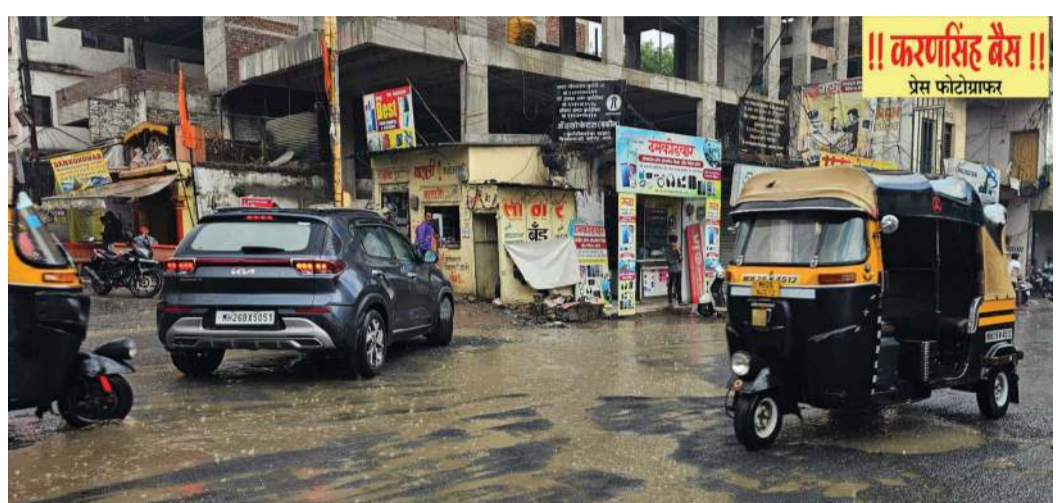
नांदेड : मोठ्या प्रतीक्षेनंतर नांदेड शहरातही पावसाचे आगमन झाले.

मुंबई (प्रतिनिधी) - मुंबईसह राज्यात मॉन्सून दाखल झाला. जोरदार पाऊस सर्वदूर सुरू आहे. गेल्या काही दिवसांपासून खडलेला मॉन्सून राज्यात दाखल झाला. दमदार पाऊस सुरू आहे. शेतकऱ्यांसाठी ही आनंदाची बाब आहे. तसेच २५, २६, २७, २८ पर्यंत राज्यात असाच धो धो पाऊस राहण्याचा अंदाज आहे. अनेक भागात रात्रभर पाऊस सुरू आहे. मुंबईसह उपनगरांमध्ये रात्रभर पाऊस होता. अनेक भागात पाणी साचले आहे. कुर्ला, किंग सर्कल आणि सायममध्ये पाणी साचले. भारतीय हवामान विभागाने मुंबई, ठाणे, पालघरमध्ये पावसाचा येलो अलर्ट जारी केला. मॉन्सून राज्याभरात पसरला आहे. पुढील ३ तास अतिमुसळधार पावसाचा इशारा हवामान विभागाने दिला. या पावसामुळे रस्ते जलमय झाले. पुढील दोन ते तीन दिवस अरबी समुद्र, महाराष्ट्र, गुजरात, मध्यप्रदेशच्या दिशेने मॉन्सून पुढे सरू शकते आहे.