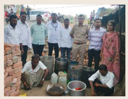
कार्यकारी निरीक्षक, टु.निरीक्षक व भारी पथक यांनी दि. २९ मे २०२६ ते ८ जून २०२६ रोजी एकूण १४२ कारवाया केल्या आहेत. मोहिमेदरम्यान तेरा हजार एकशे वीस लिटर रसायन, २४२. २६ लिटर देशी दारू, आठ लिटर विदेशी, तीन लिटर बियर, १६४६ लिटर ताडी आणि १ हजार ९८ लिटर हातभट्टी दारू असा मुद्देमाल जप्त करून १४२