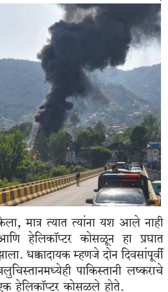
केला, मात्र त्यात त्यांना यश आले नाही आणि हेलिकॉप्टर कोसळून हा प्रयात झाला. धक्कादायक म्हणजे दोन दिवसांपूर्वी बलुचिस्तानमध्येही पाकिस्तानी लष्कराचे एक हेलिकॉप्टर कोसळले होते.

श्रीनगर (प्रतिनिधी)- पाकव्यास मुझफ्फराबादमध्ये पाकिस्तानच्या लष्कराचे एमआय-१७ हेलिकॉप्टर कोसळल्याची घटना घडली आहे. हेलिकॉप्टरमधील वैमानिकासह सर्वच २१ सैनिकांचा मृत्यू झाला आहे. हेलिकॉप्टरमध्ये वैमानिकासह २१ सैनिक असल्याची माहिती समोर येत आहे. या दुर्घटनेमुळे पाकिस्तान लष्करामध्ये मोठी खळबळ उडाली आहे. प्राथमिक माहितीनुसार, हे हेलिकॉप्टर पाकव्यास काश्मीरमधील 'नीलम व्हॅली' भागात अतिरिक्त जवानांना घेऊन जात होते. याचदरम्यान, मुझफ्फराबादजवळ उड्डाण घेत असतानाच अचानक हेलिकॉप्टरमध्ये तांत्रिक बिघाड झाला. वैमानिकाने परिस्थिती नियंत्रणात आणत आपत्कालीन लँडिंग करण्याचा प्रयत्न