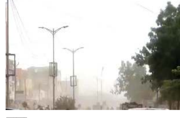
नांदेड शहर व जिल्ह्यात रविवारी दुपारी

नांदेड (प्रतिनिधी) - शहर आणि जिल्ह्यात मागील आठ दिवसांपासून तापमानात प्रचंड मोठ्या प्रमाणात वाढ झाली होती. रविवारी दुपारी साडेचारच्या सुमारास अचानक ढग भरून आले आणि वेगाच्या वादळीवाऱ्यासह पावसाचे आगमन झाले. अचानक आलेल्या पावसामुळे जनजीवन चांगलेच विस्कळीत झाले होते. मान्सूनपूर्व पावसाच्या आगमनाने शेतकऱ्यांच्या पेरणीपूर्व मशागतीच्या कामात अडथळा निर्माण झाला.