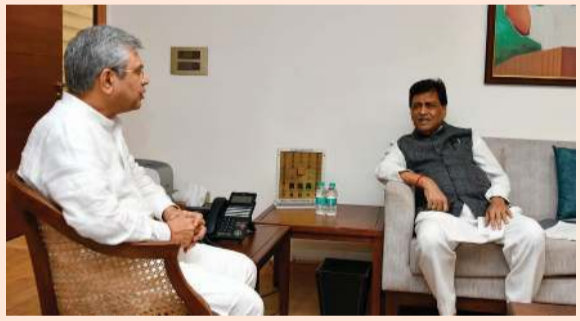
भेट घेऊन सविस्तर निवेदन दिले. रेल्वे गाड्यांची दुरुस्ती, स्वच्छता आणि तांत्रिक तपासणीसाठी आवश्यक असणारे तीन विशेष ट्रॅक अर्थात पिट लाईन सध्या नांदेड स्थानकाच्या मुख्य आवारात आहेत.

नांदेड (प्रतिनिधी) - हजूर साहेब नांदेड रेल्वे स्थानकावरील प्रवाशांची वाढती संख्या आणि भविष्यातील गरजा लक्षात घेता, येथील तीन 'पिट लाईन' जवळच असलेल्या मालटेकडी रेल्वे स्थानकावर स्थानांतरित करण्याच्या मागणीला रेल्वेमंत्री अश्विनी वैष्णव यांनी सकाळीच प्रतिपादित केले आहे. खा. अशोकराव चव्हाण यांनी या संदर्भात केलेल्या पाठपुराव्याची दखल घेत, हा प्रस्ताव तातडीने मार्गी लावण्याचे निर्देश रेल्वेमंत्र्यांनी अधिकाऱ्यांना दिले आहेत. खा. अशोकराव चव्हाण यांनी नवी दिल्ली येथे रेल्वेमंत्र्यांची प्रत्यक्ष