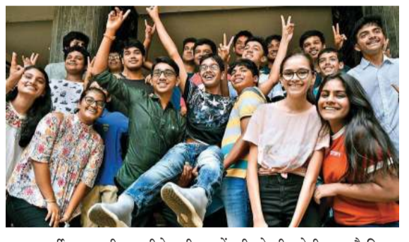
यावर्षी दहावी परीक्षेसाठी नांदेड जिल्ह्यातून ४८ हजार ६९ विद्यार्थ्यांनी प्रत्यक्ष नोंदणी केली होती. त्यापैकी ४७ हजार ३३३ विद्यार्थ्यांनी प्रत्यक्ष

नांदेड (प्रतिनिधी) - महाराष्ट्र राज्य माध्यमिक व उच्च माध्यमिक शिक्षण मंडळाच्या लातूर विभागांतर्गत फेब्रुवारी - मार्च २०२६ मध्ये घेण्यात आलेल्या इयत्ता दहावी परीक्षेचा निकाल शुक्रवार, दि. ८ मे रोजी दुपारी ऑनलाईन (अधिकृत संकेतस्थळावर) जाहीर करण्यात आला. यात नांदेड जिल्ह्याचा निकाल ८३.६२ टक्के लागला असून या परीक्षेतही मुलींनीच बाजी मारली आहे.