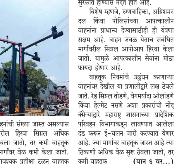
रस्त्यावर वाहनांची संख्या जास्त असल्यास त्या मार्गावरील हिरवा सिग्नल अधिक वेळ सुरू ठेवला जातो, तर कमी वाहतूक असलेल्या मार्गावर वेळ कमी केला जातो. त्यामुळे अनावश्यक प्रतीक्षा टाळून वाहतूक सुरळीत होण्यास मदत होत आहे.