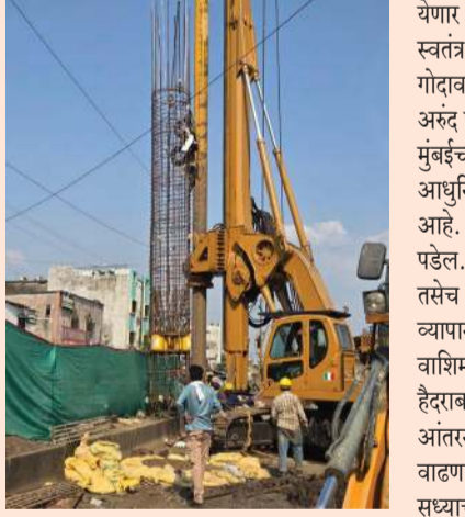
समृद्धी महामार्गात नांदेड शहरातील हिंगोली गेट- बाफना चौक- देगलूर नाका ते छत्रपती चौक, धनेगाव जंक्शन या ४.४८ किलोमीटर लांबीच्या मार्गावर चारपदरी उड्डाणपूल उभारण्यात येणार असून, स्थानिक वाहतुकीसाठी पुलाखाली स्वतंत्र स्लिप रोडची व्यवस्था केली जाईल. गोदावरी नदीवरील १२० वर्षांहून अधिक जुना व अरुंद पूल हटवून त्याजागी अधिक सुरक्षित आणि मुंबईच्या सी-लिंकप्रमाणे केबल स्ट्रेट पद्धतीचा आधुनिक आकर्षक नवीन पूल बांधण्यात येणार आहे. या प्रकल्पामुळे शहराच्या सौंदर्यात भर पडेल. नांदेड हे शीख धर्मियांचे पवित्र तीर्थक्षेत्र तसेच राज्यातील एक महत्त्वाचे शैक्षणिक व व्यापारी केंद्र आहे. या मार्गावरून अकोला, वाशिम, हिंगोली आणि शेजाऱ्याच्या तेलंगणातील हैदराबाद, संगरेड्डी, बिचकुंदाकडे जाणारी मोठी आंतरराज्यीय व जड वाहतूक चालते. झपाट्याने वाढणारी वस्ती आणि वाढत्या वाहतुकीमुळे सध्याच्या रस्त्यांवर व जुन्या पुलावर मोठा ताण येत होता. नव्या प्रकल्पामुळे वाहतूक सुळीत होऊन प्रवासाचा वेळ वाचेल आणि धार्मिक पर्यटन तसेच आर्थिक विकासाला मोठी चालना मिळेल.

मिळेल, असा विश्वास माजी मुख्यमंत्री खासदार अशोकराव चव्हाण यांनी व्यक्त केला आहे. नांदेड जिल्ह्याचे पालकमंत्री असताना खा. अशोकराव चव्हाण यांनी मुंबई-नागपूर हिंदूदहयसम्राट बाळासाहेब ठाकरे समृद्धी महामार्गाचा विस्तारित प्रकल्प म्हणून जालना-नांदेड जोडमहामार्गाला मंजुरी मिळवून घेतली होती. या महामार्गामुळे नांदेड, हिंगोली व परभणी जिल्ह्यांना समृद्धी महामार्गाला थेट कनेक्टिव्हिटी मिळणार असून, छत्रपती संभाजीनगर, नाशिक, मुंबई सारख्या महत्त्वाच्या शहरांसाठी लागणारा प्रवासाचा वेळ कमी होणार आहे. नांदेड शहरातील हिंगोली गेट ते देगलूर नाका परिसरासह गुंडेगाव, विष्णुपुरी परिसरात तीन ठिकाणी या प्रकल्पाचे प्रत्यक्ष काम सुरु झाले आहे. यासंदर्भात प्रतिक्रिया देताना खा. अशोकराव चव्हाण म्हणाले की,