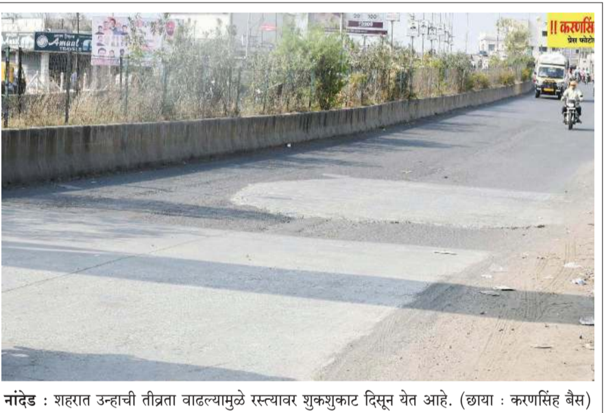
नांदेड : शहरात उन्हाची तीव्रता वाढल्यामुळे रस्त्यावर शुष्कशाकट दिसून येत आहे.