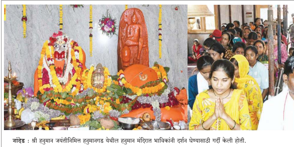
नांदेड : श्री हनुमान जयंतीनिमित्त हनुमानगड येथील हनुमान मंदिरात भाविकांनी दर्शन घेण्यासाठी गर्दी केली होती.

नांदेड (प्रतिनिधी) - तालुक्यातील सावरगाव येथील युवकांने एका समाजाच्या धर्मगुरूबद्दल अपशब्द वापरून सोशल मीडियावर पोस्ट व्हायरल केली होती. ही माहिती काही कार्यकर्त्यांना समजल्यानंतर त्या युवकास कार्यकर्त्यांनी पकडून समाजाची माफी मागायला लावली होती. परंतु हा व्हिडिओ पुन्हा व्हायरल झाला. या प्रकरणाचे मुखेड शहरामध्ये गुन्हा पडसाद उमटले. या प्रकरामुळे शहरात तणावाचे वातावरण निर्माण झाले. दोन दिवसांपूर्वी मुखेड