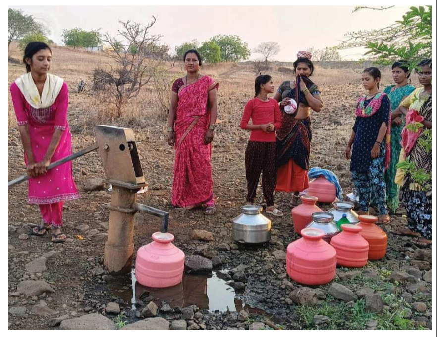
मुखेड - मुखेड शहरासह तालुक्यातील आबादीनगर तांडा, वसूर तांडा, भवानी तांडा व इतर ठिकाणी पाणीटंचाईचे भीषण संकट दिसत आहे. पिण्याच्या पाण्यासाठी महिला व युवती भटकंती करताना घेतलेले छायाचित्र.