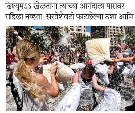
दिस्युमऽऽ खेळताना त्यांच्या आनंदाला पारावर राहिला नव्हता. सरतेशेवटी फाटलेल्या उशा आणि त्यातील त्यातील कापूस अस्ताव्यस्त पसरलेला, असे चित्र मैदानावर दिसून आले. अर्बन ग्ले फ्राऊंड मूव्हमेंट या संस्थेच्या वतीने एप्रिल महिन्याच्या पहिल्या