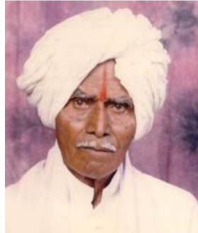
महाराष्ट्रातील खेड्या पाड्यात भटकंती करीत