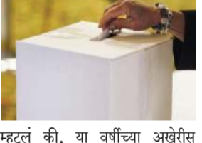
म्हटलं की, या वर्षाच्या अखेरीस होणाऱ्या जिल्हा परिषद आणि पंचायत समिती निवडणुकाही बॅलेट पेपरने घेतल्या जातील. १० वी, १२ वीच्या परीक्षा संपल्यानंतर २५ मे झाल्यावर स्थानिक निवडणुका घोषित केल्या जातील. यावेळी ईव्हीएमपेवजी बॅलेट पेपरचा वापर केला जाईल असे त्यांनी सांगितले. निवडणूक आयोगाने ईव्हीएम न वापरता बॅलेट पेपरवर