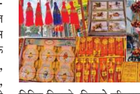
निमित्त सिडको-सिडको परिसरातील बाजारपेठेत अनेक आकर्षक अशी दुकानांची सजावट करण्यात आली आहे. रक्षाबंधन निमित्ताने अनेक कलाकृतीतून नवीन स्वरूपातील तिरंगा राखी, कुंदन, मारवाडी, रेशीम, सोनेरी, कोल्हापुरी चांदीची, रुद्राक्ष तर लहान मुलासाठी बेनेटन, कार्टून, म्यूजिकल, लाईट, गोंडा, अशा अनेक प्रकारच्या राख्या बाजारपेठेत महाराष्ट्र, गुजरात, हैद्राबाद या राज्यातील अनेक जिल्हातून आणल्या आहेत.

नवीन नांदेड (प्रतिनिधी) - सिडको - हडको परिसरातील बाजारपेठेत नारळी पौर्णिमा रक्षाबंधन सणानिमित्ताने विविध राख्या अनेक व्यापाऱ्यांनी सयारा, पुण्या, विराट, राधा, कृष्ण, ओम स्वास्तिक, महाकाल, मैरे भैया, गणपती कमल, अंपल, मोटू-पतलू यासह विविध आकर्षक राख्या बाजारात आल्या आहेत. या राख्या महाराष्ट्र राज्यातील मुंबई, पुण्यासह गुजरातमधील सुरत, अहमदाबाद येथून आकर्षक व नवीन स्वरूपातील विविध कलाकृती असलेल्या राख्या बाजारपेठेत उपलब्ध झाल्याने बाजारपेठेत महिलांसह युवतींची मोठ्या प्रमाणात गर्दी पाहावयास मिळत आहे.